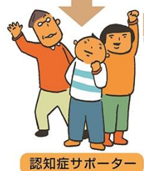
認知症サポーター